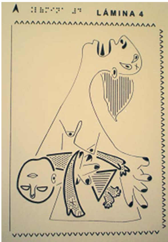
Figura 5. Lámina 4: Mujer con su hijo muerto en brazos

Otras características del cuadro, en cambio, facilitaban la adaptación. Tal es el caso de la ausencia de perspectiva o de una sensación clara de profundidad en el cuadro. Picasso introduce algunos elementos que generan un espacio impreciso y contradictorio, a medio camino entre un interior y un exterior. Pero dichos elementos no son especialmente significativos en el conjunto del cuadro y pueden ser fácilmente explicados y entendidos a través de una adecuada descripción. Además, las figuras son en general bastante planas, por lo que el hecho de que las láminas de papel microcapsulado sólo permitan dos alturas de relieve no fue en absoluto una limitación para la presentación de la información.