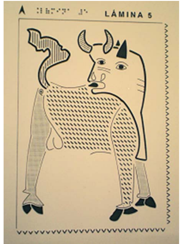
Figura 6. Lámina 5: Toro

Otras características del cuadro, en cambio, facilitaban la adaptación. Tal es el caso de la ausencia de perspectiva o de una sensación clara de profundidad en el cuadro. Picasso introduce algunos elementos que generan un espacio impreciso y contradictorio, a medio camino entre un interior y un exterior. Pero dichos elementos no son especialmente significativos en el conjunto del cuadro y pueden ser fácilmente explicados y entendidos a través de una adecuada descripción. Además, las figuras son en general bastante planas, por lo que el hecho de que las láminas de papel microcapsulado sólo permitan dos alturas de relieve no fue en absoluto una limitación para la presentación de la información.