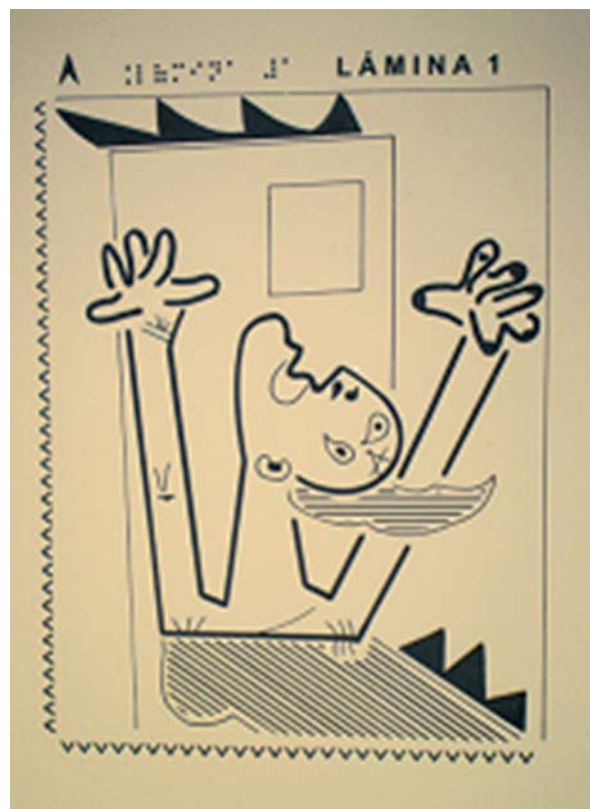
Figura 2. Lámina 1: Mujer quemándose