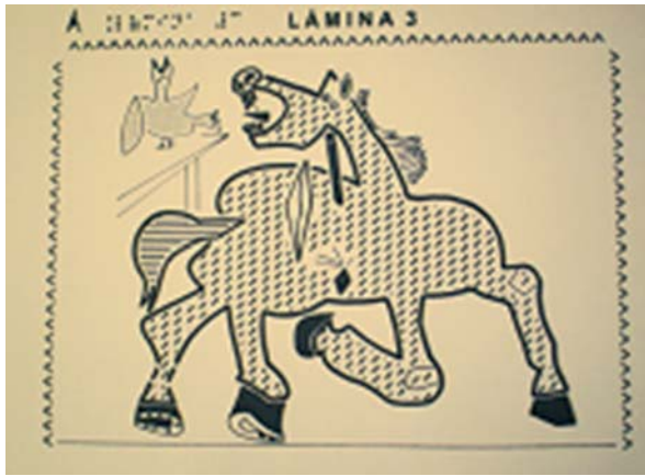
Figura 4. Lámina 3: Caballo